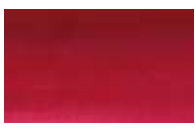
656 *** ■ Vermelho Naftol PR170