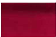
635 *** ■ Vermelho Carmim PR177