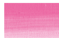
658 *** ■ Rosa de Quinacridona PR122/PW6