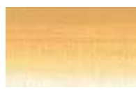
250 *** ■ Ocre Cor de Pele PW6/PY42/PR101