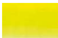
574 *** ■ Amarelo Primário PY74