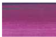
905 *** ■ Violeta Avermelhado PR122/ PV23