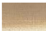
705 *** ■ Cinzento Quente PW6/PY42/PR101/PBk11