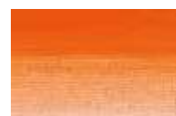
615 *** ■ Tom Vermelho Cádmio nr