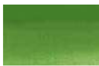
815 *** ■ Verde Óxido Cromado PG17