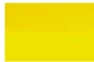
501 *** □ Amarelo Limão PY3