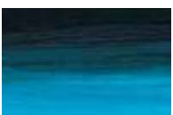
341 *** ■ Turquesa Ftalocianina PB16