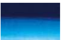
385 *** ■ Azul Primário PB15:3