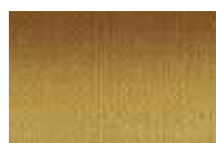
028 *** ■ Ouro Pigments iridescents, PY3