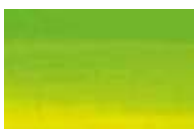
871 *** ■ Verde Amarelo Vivo PY74 / PW6 / PG 36