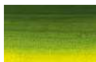
819 *** ■ Verde Sap PY150/PG7/PBk23