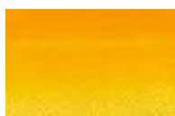
543 *** ■ Tom Amarelo Cádmio Escuro nr