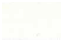
116 *** ■ Branco de Titânio PW6/PW4