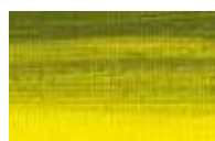
851 *** ■ Grão Verde PY65/PY3/PBk 32