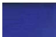
314 *** ■ Azul Ultramar Francês PB29