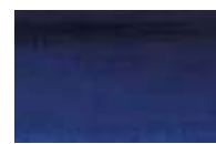
395 *** ■ Azul Antraquinona PB 60