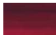
695 ** ■ Laca Alizarina Carmesim PR83