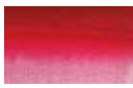
618 *** ■ Tom Vermelho Cádmio Escuro nr/ PR122