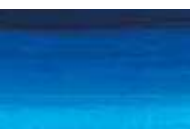
323 *** ■ Tom Azul Cerúleo PB15:4/PW6