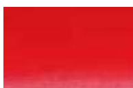
613 *** ■ Tom Vermelho Cádmio Claro nr