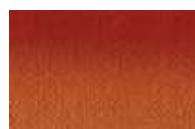
036 *** ■ Cobre Pigments iridescents