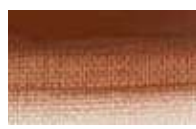
211 *** ■ Terra Siena Queimada PR101 / PBk7