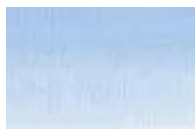
301 *** ■ Azul Cinza PW6/PB29/PBk11