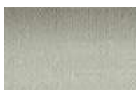
029 *** ■ Prata Pigments iridescents, PBk7