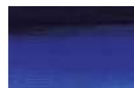
312 *** ■ Azul Ultramar Claro PB29