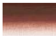
629 *** ■ Vermelho Índio PR101