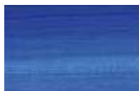
303 *** ■ Tom Azul Cobalto PB29/PB15:3/PW6